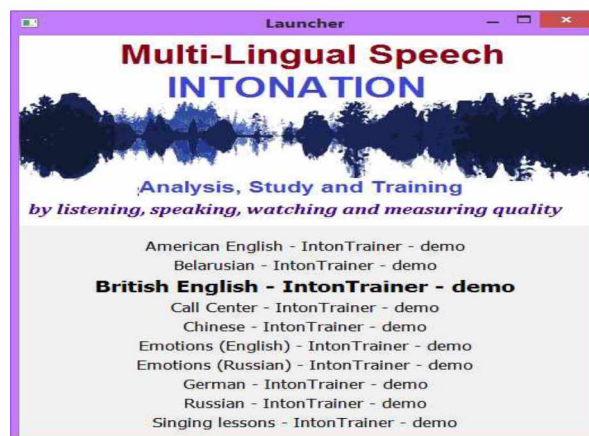
Рис. 2. Модуль запуска прикладных задач (Launcher)

Программный комплекс « IntonTrainer » является открытой системой. Допускается модификация используемых настроек и аудио данных. Эталонные БД – PATTERNS –, могут быть дополнены или модифицированы пользователем в соответствии с поставленной задачей, либо сформированы заново для работы с новыми языковыми приложениями.