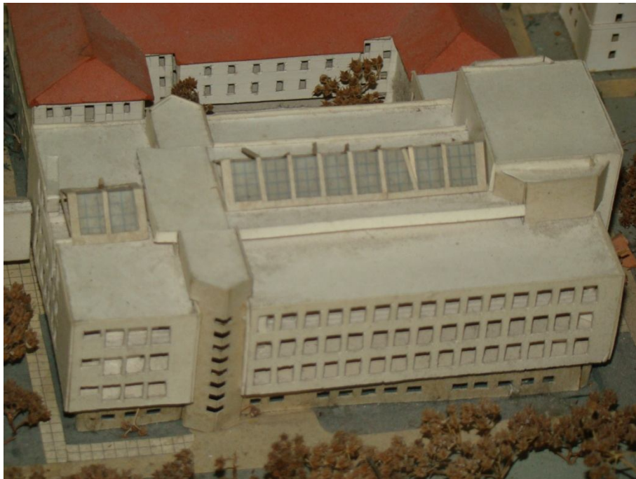
Фота 6. Макет вучэбнага корпуса МДЛУ (праект 2012 г.)

Паводле планавага задання па гэтым аб'екце прадугледжвалася 1 будаўніцтва двухпавярховага будынка-ўстаўкі з прымыканнем да двух прылеглых вучэбных карпусоў на ўзроўні 2 і 3-га паверхаў, а таксама размяшчэннем некалькіх вучэбных памяшканняў, у тым ліку чытальнай залы, электроннай і Аўстрыйскай бібліятэкі, а таксама дзвюх вучэбных аўдыторый. Але галоўным у гэтым аб'екце можна лічыць калідор-пераход, які злучыў вучэбныя карпусы і замкнуў усе будынкi ў адзіны комплекс. Нагадаем, што акт аб прыёмцы завершанага будаўніцтва і ўвядзенні ў эксплуатацыю перахода і вучэбных аўдыторый быў падпісаны 30 лістапада 2004 г. [27]. Але рэктарат універсітэта ва ўмовах пастаяннага павелічэння агульнай колькасці студэнтаў планаваў пашырыць вучэбную плошчу лінгвістычнай установы адукацыі. Пра гэта яскрава сведчыць праект (фота 6), падрыхтаваны па заданні рэктарата з улікам пабудовы новага корпуса на ўнутранай тэрыторыі ўніверсітэта. І калі рэалізацыя гэтага праекта на гэты момант не стала фактам сучаснай гісторыі, бюспрэчнымі доказам мэтанакіраванага ўдасканалення аўдыторнага фонду вучэбных карпусоў, комплексу актавай і спартыўнай залаў універсітэта з'яўляецца іх пастаяннае абнаўленне згодна з патрабаваннямі часу.