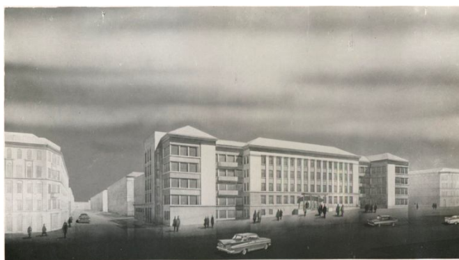
Фота 3. Макет карпусоў МДПІЗМ архітэктара І. І. Есьмана (1962 г.)

Пасля завяршэння будаўнічых работ і ўвядзення ў 1964 г. вучэбнага корпуса на Омскім завулку І. І. Есьман распрацоўвае архітэктурна-будаўнічую дакументацыю на вучэбны корпус па Вайсковым завулку. Як і ў вучэбным корпусе па Омскім завулку, 32-гадовы архітэктар шукае новыя рашэнні злучэння вучэбных карпусоў па вул. Захарова з дапамогай аднапавярховага вестыбюля [20, арк. 6]. Праектная частка была распрацавана з улікам размяшчэння ў корпусе наступных памяшканняў: 36 аўдыторый на 14 чалавек, 4 аўдыторыі на 25 чалавек, 8 аўдыторый на 65 чалавек, 4 аўдыторыі на 104 чалавекі, 1 аўдыторыя для паказу кінафільмаў на 247 чалавек, 6 аўдыторый для індывідуальных заняткаў. Ва ўсіх памяшканнях планаваліся паркетныя палы і шырокія вокны [19, арк. 8]. Узвядзенне будынка, распачатае ў 1965 г., было праз год паспяхова завершана. Добра папрацавалі студэнты МДПІЗМ у трэцім працоўным семестры на будаўніцтве новага вучэбнага корпуса [21, арк. 53].