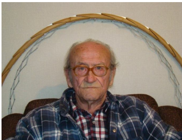
Фота 4. Архітэктар І. І. Есьман.

Паводле слоў архітэктара І. І. Есьмана, унікальнасць пабудовы новых вучэбных карпусоў выявілася ў тым, што ў будаўніцтве грамадзянскіх збудаванняў упершыню былі выкарыстана прамысловыя напрацоўкі (фота 4, 5), што стала магчымым дзякуючы рацыяналізатарскай прапанове кіраўніка архітэктурна-канструктарскай майстэрні «Мінскпраекта» архітэктара Н. І. Шпігельмана. У выніку гэтага былі спалучаны перадавыя тэхналогіі, якія на той час выкарыстоўваліся ў прамысловай архітэктуры, значна паскорана ўзвядзенне карпусоў грамадзянскага будаўніцтва, якія набывалі арыгінальнае архітэктурнае і мастацкае вырашэнне. Сярод знаходак архітэктар называе таксама канструкцыю акон, вопыт выканання якіх быў запазычаны з Літвы. Вокны мелі вугал гарызантальнага паварочвання больш за 90 градусаў і не заміналі асвятленню памяшканняў. Не менш арыгінальным на той час было і выкарыстанне цаглянай вертыкальнай устаўкі для разбіцця гарызантальных ліній будынка і надання ім асобнага кантрасту праз выкарыстанне чорна-белых будаўнічых матэрыялаў. Гэтыя і іншыя важныя ідэі архітэктара сталі асновай спачатку праектных заданняў, а потым пабудовы двух вучэбных карпусоў інстытута [24].