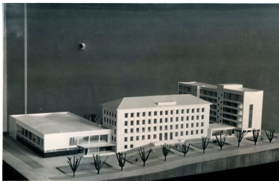
Фота 2. Макет будынкаў МДПІЗМ архітэктара І. І. Есьмана (1962 г.)

вул. Захарова і Вайсковым завулку паўставаў 6-павярховы будынак з бібліятэкай і кнігасховішчам. На рагу вул. Захарова і Омскім завулку праектаваўся корпус з актавай і спартыўнай заламі (фота 2, 3) [19, арк. 27].