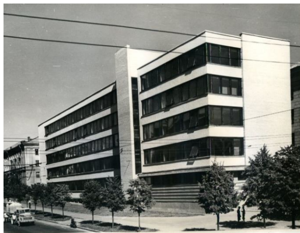
Фото 5. Вучэбны корпус МДПІЗМ (1964 г.). Аўтар І. І. Есьман.

Работы па вонкавым аздабленні і ўнутранай мадэрнізацыі вучэбных карпусоў і комплексу з актавай і спартыўнай заламі інстытута і надалей не спыняліся. Так, у пачатку 1980-х гадоў рэктаратам інстытута была ініцыяравана распрацоўка архітэктурна-планіровачнага задання на выкананне праекта перахода паміж вучэбнымі карпусамі па Омскім завулку, а таксама надбудовы пятага паверха на будынак інтэрната [3, с. 220]. Аднак на той час рэалізаваць гэтыя планы не атрымалася. Новая спроба пабудовы ўстаўкі як асобнага будынка была ажыццёўлена толькі ў пачатку нулявых гадоў. У лютым 2003 г. рэктарам універсітэта Н.П. Баранавай было зацверджана заданне на праектаванне аб'екта «ўстаўкі паміж карпусамі ўніверсітэта па вул. Румянцава, 10–12» [25]. 6 сакавіка 2003 г. Мінгарвыканкам прыняў рашэнне дазволіць універсітэту правядзенне праектна-пошукавых работ па будаўніцтве будынка-ўстаўкі паміж вучэбнымі карпусамі ўніверсітэта [26].