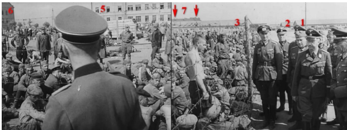
Рис. 2. Рейхсфюрер Гиммлер в лагере военнопленных Дулаг 126 (Пушкинские казармы) по Логойскому тракту. На заднем фоне – кирпичные 3-этажные здания № 5, № 6, № 7 по Логойскому тракту (ул. Я. Коласа).

В архивах сохранилась кинохроника продолжительностью 2 минуты 20 секунд, на которой кинооператором Вальтером Френтцем сняты отдельные моменты визита рейхсфюрера Гиммлера (рис. 2):