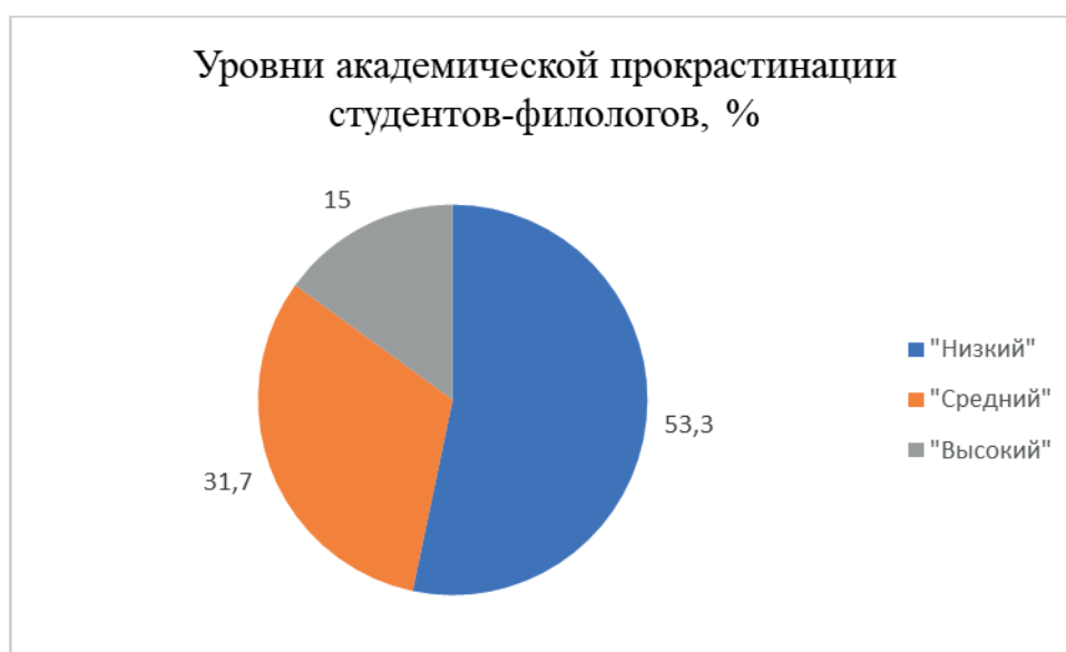
Рис. 3. Процентное распределение студентов-филологов по степени выраженности общей прокрастинации, %

Результаты проведенного исследования свидетельствуют о том, что в выборке будущих филологов преобладают испытуемые со средней выраженностью шкалы «Общей прокрастинации» (68,3 % – 41 человек). У таких студентов частично снижено качество деятельности и ее эффективность, менее развиты механизмы саморегуляции, такие, как планирование и целеполагание, порой эти обучающиеся не имеют необходимых навыков для своевременного выполнения учебных задач. Реже среди испытуемых данной выборки можно встретить студентов с «низкой степенью» (26,7 % – 16 человек). Это говорит о том, что у них имеется выраженная мотивация учебной деятельности и хороший самоконтроль. Очень редко в анализируемой группе встречаются обучающиеся с «высокой степенью» проявления «задержки решения учебных задач» (5,0 % – 3 человека), что указывает на их мотивационную недостаточность и проблемы с регуляцией активности (рис. 3). В целом такая степень прокрастинации, на наш взгляд, связана с несформированностью учебных навыков, неорганизованностью, забывчивостью и общей поведенческой ригидностью студентов.