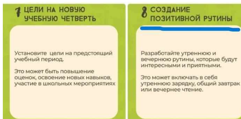
Рис.1. Пример (1) употребления слова рутина

Приведем пример из нашей практики. С недавнего времени нас заинтересовало бытие слова рутина , которое стало употребляться в современной русской речи в новом значении “привычка; элемент распорядка дня” (без дополнительных коннотативных признаков неодобрительности, негативного отношения к заостенелости привычек; напротив, с коннотацией чего-то позитивного, доброго, полезного). На рис. 1 приведен пример употребления слова рутина в контексте советов по возвращению детей в учебный режим после каникул (из социальной сети одной из Школ Скорочтения).