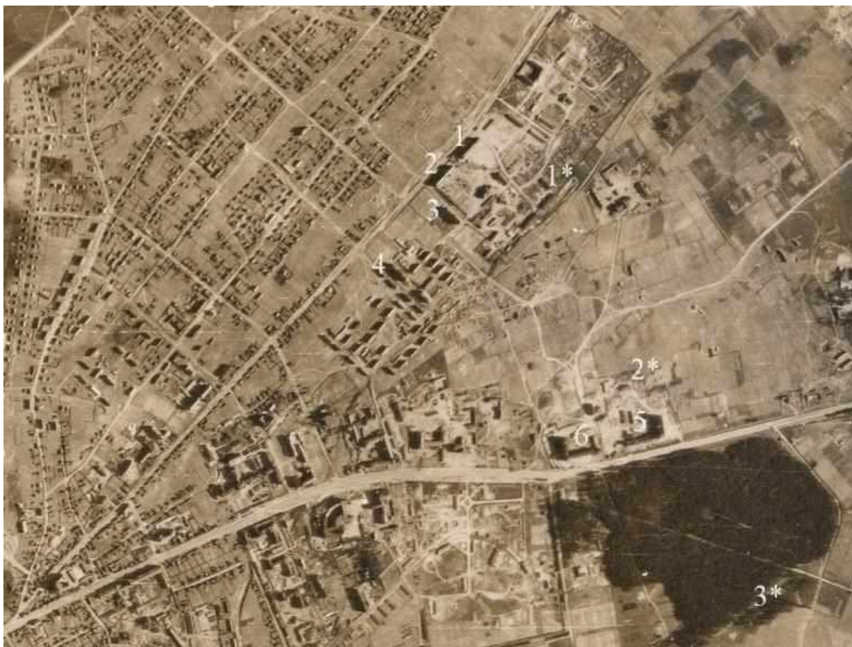
Рис. 1. Лазарет «Пушкинские казармы» и ревир лагеря Ролльбан (Lazarett Puschkinkaserne und Revir Lager Rollbahn) [3]

В середине 1950-х гг. оба дома были достроены, соединены центральным фасадом с арками и приняли современный вид.