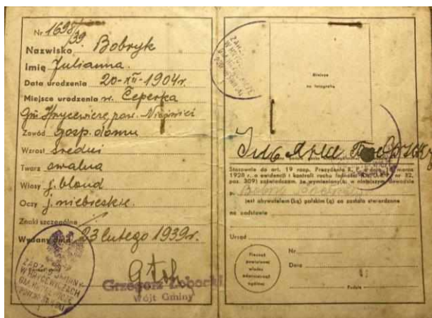
Фота 1. Пашпарт Ульяны Бобрык (старонкі 2, 3)

У асабістым архіве сям’і Бобрыкаў захаваўся пашпарт Ульяны Бобрык. Згодна з дакументам, Ульяна Бобрык (1904–1941) – замужняя сялянка, хатняя гаспадыня, якая мела дваіх дзяцей (дачку 1924 г.н. і сына 1926 г.н.) і пражывала ў вёсцы Цапэрка Грыцэвіцкага гміна Нясвіжскага павета Навагрудскага ваяводства (фота 1, 2) [6].