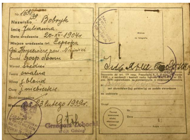
Фота 1. Пашпарт Ульяны Бобрык (старонкі 2, 3)

У асабістым архіве сям’і Бобрыкаў захаваўся пашпарт Ульяны Бобрык. Згодна з дакументам, Ульяна Бобрык (1904–1941) – замужня сялянка, хатняя гаспадыня, якая мела дваіх дзяцей (дачку 1924 г.н. і сына 1926 г.н.) і пражывала ў вёсцы Цапэрка Грыцэвіцкага гміна Нясвіжскага павета Навагрудскага ваяводства (фота 1, 2) [6].