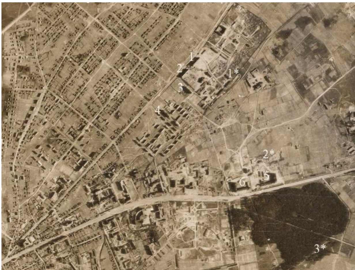
Рис. 1. Лазарет «Пушкинские казармы» и ревир лагеря Ролльбан (Lazarett Puschinkaserne und Revir Lager Rollbahn) [3]

В середине 1950-х гг. оба дома были достроены, соединены центральным фасадом с арками и приняли современный вид.