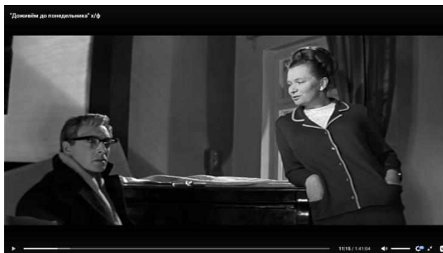
Картина №1: Фрагмент из фильма «Доживём до понедельника»