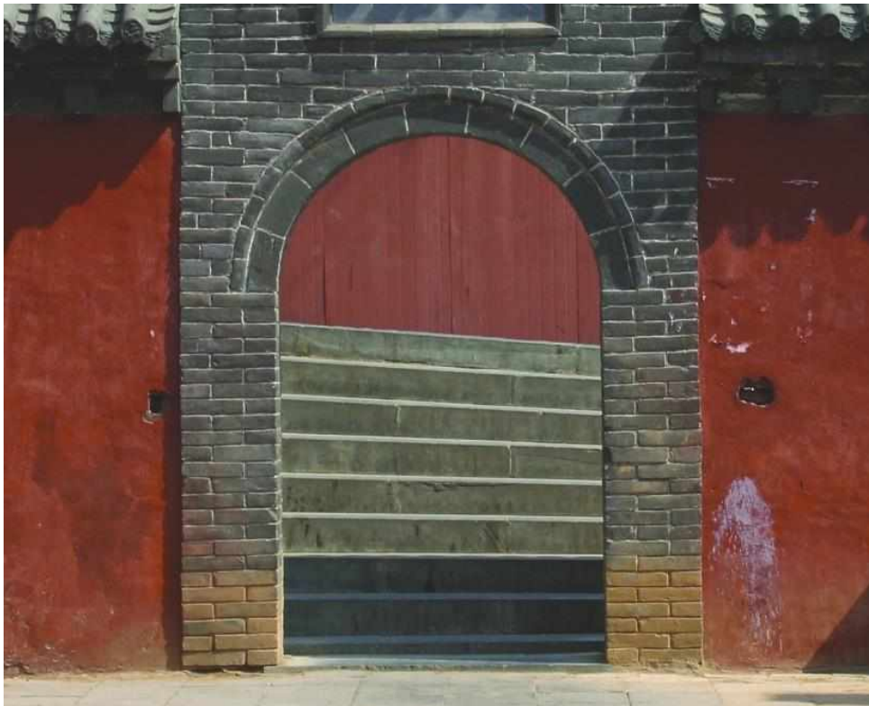
Рис. 2. «Врата. Шаолинь» (из серии «Путешествие в Китай», 2009, цветная фотография, 50×60)