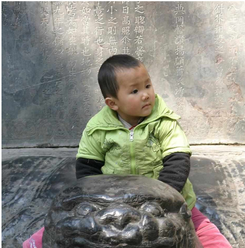
Рис. 4. «Преемственность» (из серии «Путешествие в Китай», 2009, цветная фотография, 50×60)

Таким образом, поездки белорусских художников-педагогов в 2000–2010 гг. в Китай стали настоящим мостом творческих связей, которые активно продвигают вперед прогрессивные формы художественного образовательного процесса и современного творчества. К такому увлекательному и впечатляющему дальневосточному проекту сотрудничества смогут подключиться в дальнейшем, вероятно, многие белорусские художники, желающие пережить нечто совершенно необычное, и внести свой вклад в обмен профессиональным опытом.