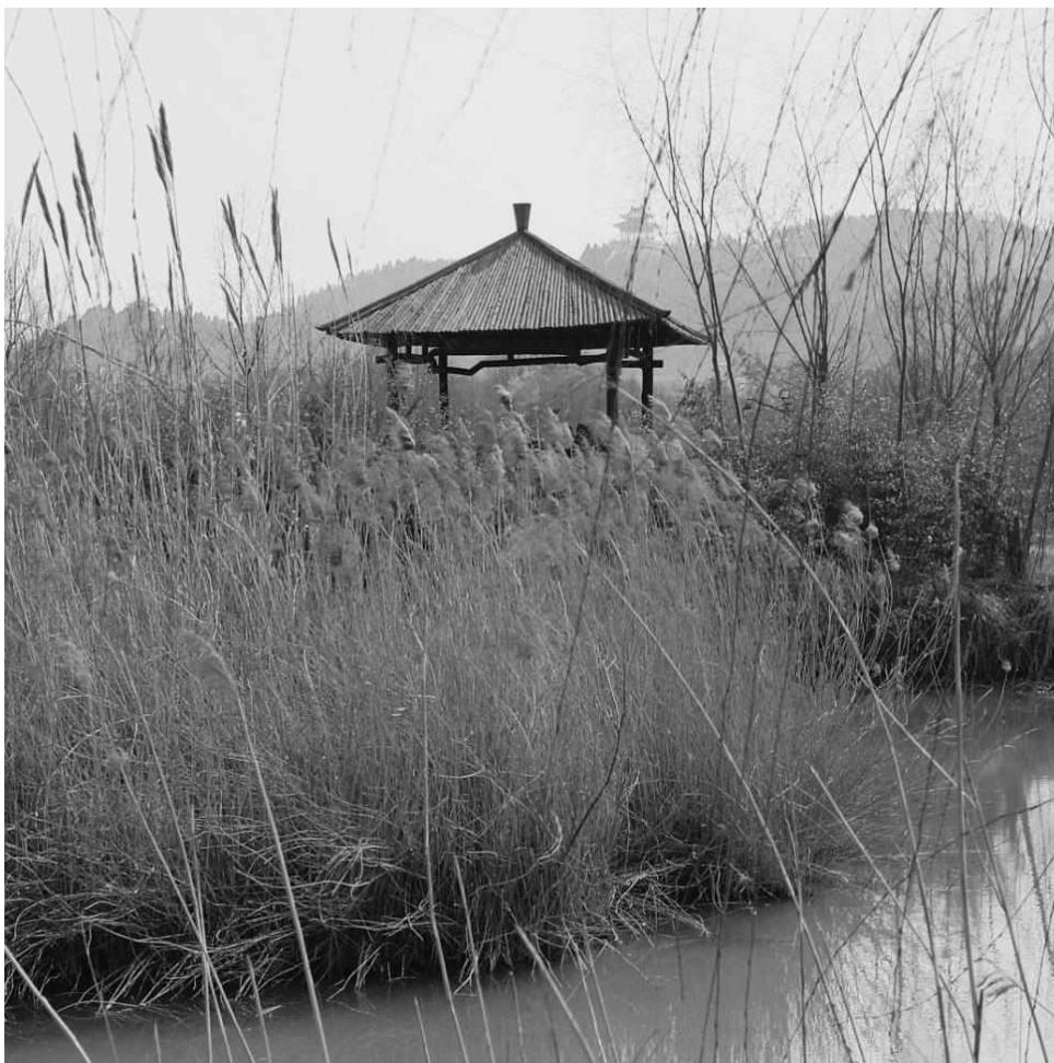
Рис. 3. «Место для медитации» (из серии «Путешествие в Китай», 2009, цветная фотография, 50×60)