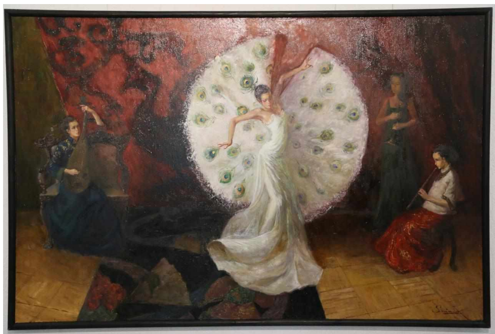
Иллюстр. 2. Сунь Чан. «Танец белого павлина», холст, масло (2016)

живописцами, но именно в Минске молодым художникам представилась возможность обратиться к ним [3, с. 30, 32].