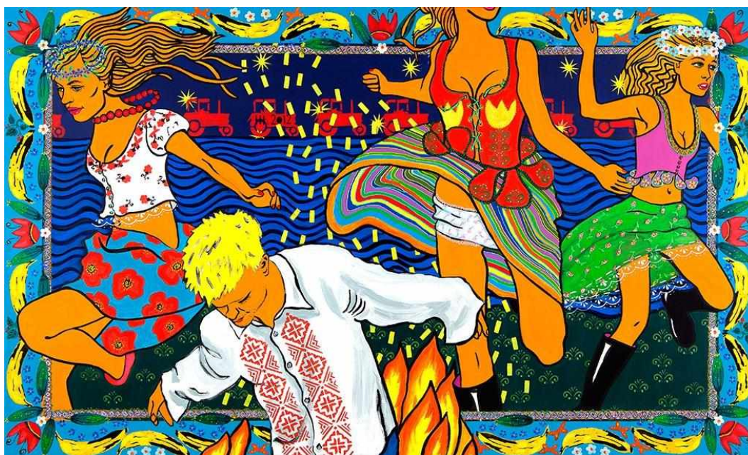
Иллюстр. 4. Жанна Капустникова «Купала» 200×120 холст, акрил (2012)

Не случайно, в 2018 году ее художественный проект «Дажынкі» 2013 года с успехом экспонировался в Китайской Народной Республике (см. ил. 5) [5].