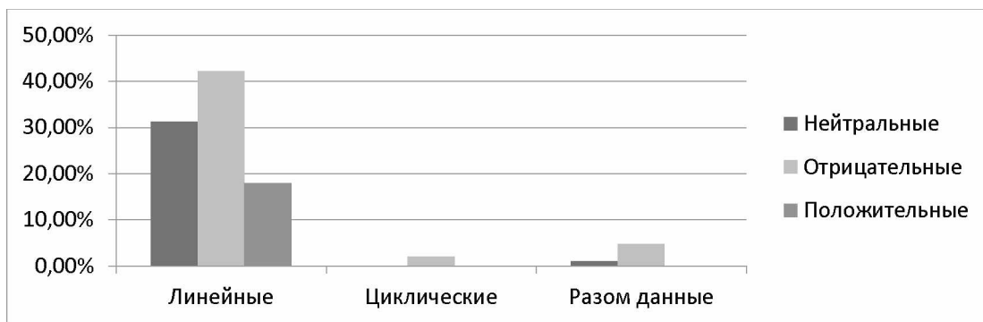
Рис. 1. Хронотопы информационной статьи

Пространственно-временная структура в информационной статье предстает прогрессирующей от прошедшего к будущему (во всех примерах подчеркнуты пространственно-временные маркеры):